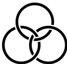
Figura 2. La sociedad mundial como movimiento nodal

No obstante, arribar a esta formulación implica un desplazamiento conceptual. Ya no entender a aquellas esferas como concreciones fenoménicas de una esencia mundial que las excede, sino desde una lógica nodal orientada por la disposición al anudamiento de elementos irreductibles entre sí (Farrán: 2016). Las propiedades que definen a la sociedad mundial para Torres son: la irreductibilidad, inseparabilidad y asimetría de aquellas esferas sociales. Una figura topológica que concentra estas propiedades y que podría otorgarle sustento teórico al concepto de sociedad mundial es el nudo borromeo –que, señala Guy Le Gaufey, ejerce “la mente en una triplicidad desacostumbrada” (2007, p. 213). Se trata del nudo caracterizado por la mutua implicación de sus elementos, de manera tal que cada registro conserva su eficacia propia “pero, asimismo, no deja de afectar al conjunto complejo de cuyo entramado impropio depende” (Farrán: 2016, p. 157). En este nudo cada cordel se anuda por un tercero relativo . Es decir, no responde a una estructura rígida que organice desde fuera los elementos, sino que la solidaridad estructural entre cada uno de sus componentes heterogéneos es la que sostiene todo el entramado, como se muestra en la siguiente figura: