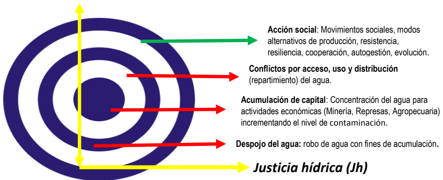
Figura 2: Correlación Seguridad alimentaria y la justicia hídrica. Elaboración propia (2018).

La justicia hídrica representa un factor fundamental para asegurar y garantizar seguridad del agua y alimentos, de modo que para lograr mayor seguridad hídrica y alimentaria (Sha) es imprescindible el desarrollo de acciones que fomenten mayor justicia hídrica (Jh). (Ver ecuación 1)