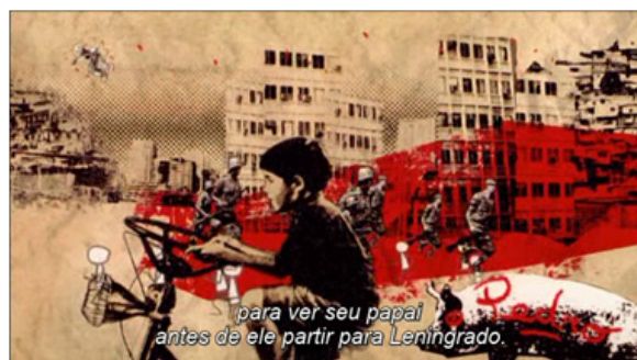
Figura 10 Teo-niño manejando bicicleta, enfrentándose a sus enemigos.

Otro tipo de herramienta empleada es la animación 2D, y se ve cuando Teo-niño en su imaginación está en unas aventuras manejando su bicicleta, enfrentando a sus enemigos para lograr ver a su papá antes que se vaya a Leningrado. Y también cuando le llega una postal de invierno, y se da cuenta que existen cuatro estaciones.