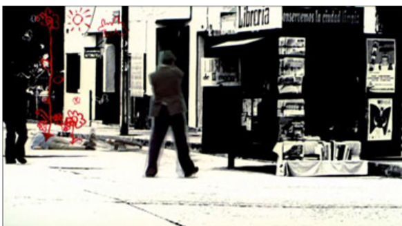
Figura 9 "La niña" dibuja un árbol con flores, en el lugar donde cae muerto un guerrillero.

Por otra parte, tomando lo dicho por García y Mendoza (2005) al hablar del significante visual, se dan esos trazos de la dibujante infantil cuando asesinan a uno de los guerrilleros y se ve un arbolito creciendo a partir de ese hombre muerto por las balas enemigas. El significante visual se encuentra en la reinterpretación de la muerte de un hombre por el nacimiento de un árbol de flores que viene a simbolizar la ingenuidad del niño.