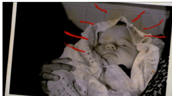
Figura 6 La niña, siendo "El bebé de Maicao".

pues dichos trazos tienen palabras "simbólicas" de la niñez, que ayudan a interpretar e ilustrar las emociones de los niños dentro de la historia, dándole un ritmo más lúdico a la narración. Esto se representa de la siguiente forma: Los trazos de líneas se observan por primera vez en la película cuando La niña explica el escape con su mamá y el uso de disfraces y nombres falsos, resaltando el que más le gustó: "El bebé de Maicao".