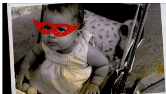
Figura 7 "La niña", siendo "El paquete".

El empleo de figuras infantiles como las máscaras para encubrir las identidades, cuando su nombre era "El paquete" o durante el robo a la tienda, en el que la líder se convierte en "La mujer maravilla" y las otras son sus aliadas, representa la tradición que más le gusta a La niña , que es el carnaval, por lo que se emplean esos trazos figurativos y representativos.