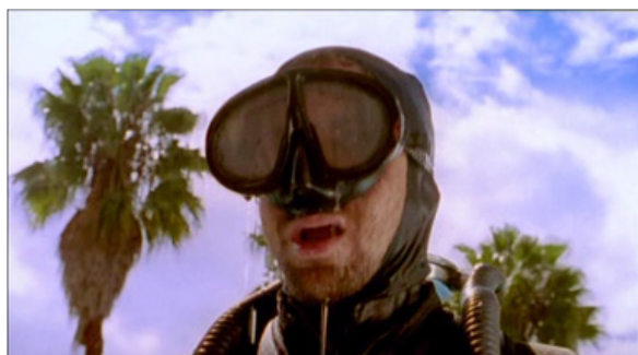
Figura 5 Teo-adulto, convertido en el "Hombre rana".

Otro personaje que reinterpreta La niña es el de la líder del grupo de mujeres que arma el plan para robar una tienda, donde enfrentan varios inconvenientes, siendo el más fuerte la no llegada de las armas para cumplir el robo, por lo que debe ingeniársela de una manera muy peculiar, a través del uso de unas ratas, ante lo cual La niña la bautiza como "La mujer maravilla", destacando su actitud guerrera y poderosa, que pelea contra los enemigos y los vence.