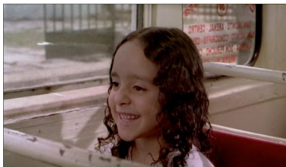
Figura 1 “La niña” narradora.

La importancia del análisis de los personajes en las películas es un elemento esencial según Sulbarán (2000), quien asevera que conocer al personaje ayuda a entender el propósito de la historia y, en el caso de esta película, uno de los personajes principales es “ La niña ” narradora, que no tiene nombre y es conocida al iniciar la historia como “la bebé de Maicao” y “el paquete”; pequeña y muy observadora de las cosas que suceden en los lugares donde se encuentra para convertirse en el “hombre invisible”, como ella se autodefine, y que es el disfraz que más le gusta. Ella no conoce el nombre verdadero de su madre, juntas se cambian los nombres cada vez que tienen que partir de un lugar a otro. Conoce a los compañeros de sus padres que están combatiendo, pero con sus nombres falsos.