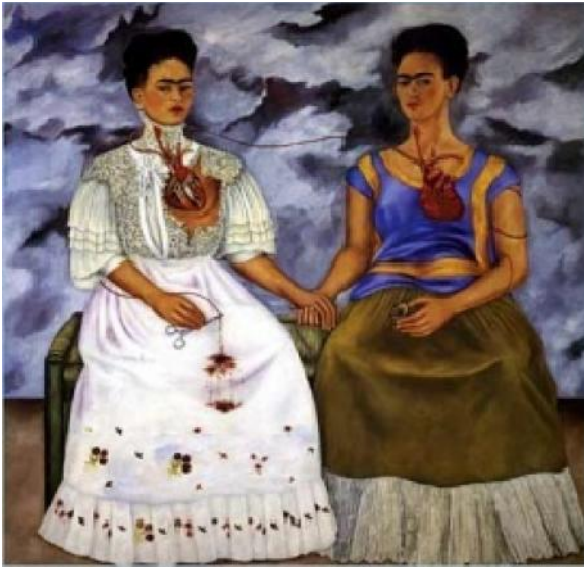
Figura 4. Las dos Fridas . 1939. Óleo sobre tela. 170 x 170 cm. Colección Museo de Arte Moderno, México.

tamente la clase poderosa de la burocracia americana y francesa” (Kettenmann, 1999, p. 26-27).