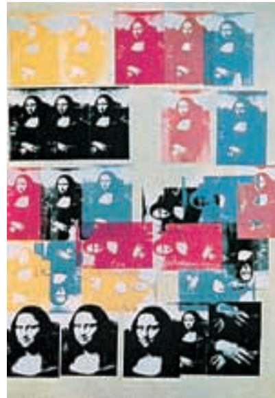
Mona Lisa Tinta serigráfica y pintura de polímero sintético sobre tela. 1963