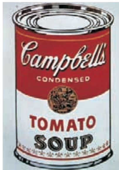
Lata de sopa Campbell's Grabado. 1969