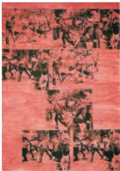
Disturbio racial rojo Pintura de polímero sintético y tinta serigráfica sobre tela. 1963