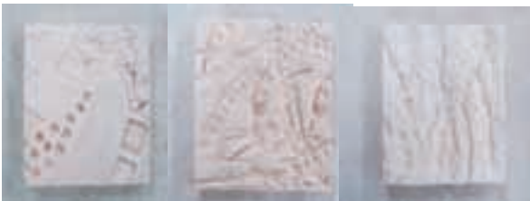
Diferentes impresiones sobre arcilla

Estas impresiones son como pequeños mundos abstractos, donde se plasmó, movimientos y texturas de la naturaleza estudiada. La textura como elemento básico es expresiva y significativa, despertando reacciones variables en el espectador.