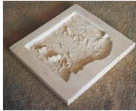
Modelo de molde

pio de impurezas, presionando con cuidado para sacar las formas del molde. Se crearon los detalles necesarios, poniendo o quitando arcilla según lo deseado. Esto con la finalidad de diferenciar una pieza de otra.