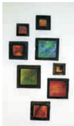
El Entorno Capturable

Asimismo, el ritmo y el orden en la composición se representan mediante líneas, armonías y repeticiones en las piezas, organizado en un esquema rítmico, imponiéndose de manera satisfactoria y clara el sentido de unidad y organización. La secuencia rítmica se obtuvo por la distribución de las masas y por la localización de los volúmenes. Esta secuencia rítmica tiene como particularidad, que puede ser vista desde varios ángulos, lo que obliga al espectador a buscar la unidad con respecto al espacio real que envuelve a la propuesta con respecto al equilibrio de las representaciones de los cubos de madera-masas-. El ritmo en la propuesta es libre, y se da por medio de la relación armónica de las masas e intervalos en las piezas.