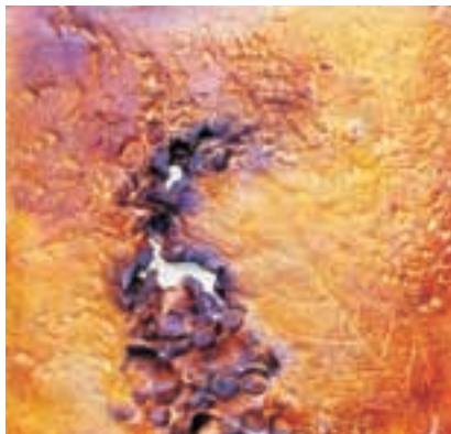
Caminos I Cerámica modelada

mejanza directa con la naturaleza sino, que sugiere a los objetos o efectos tomados de esta, como unos de los rasgos característicos de la composición.