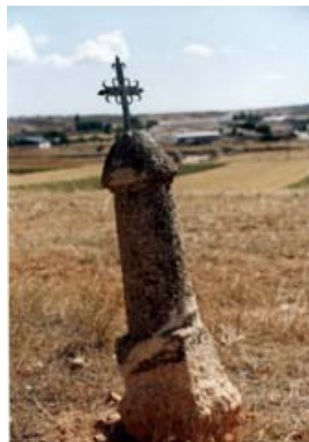
Falo situado actualmente delante del calvario.