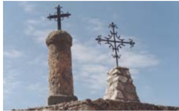
Tercer falo del calvario.