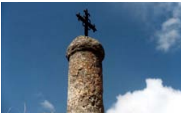
Primero de los cuatro falos del calvario.