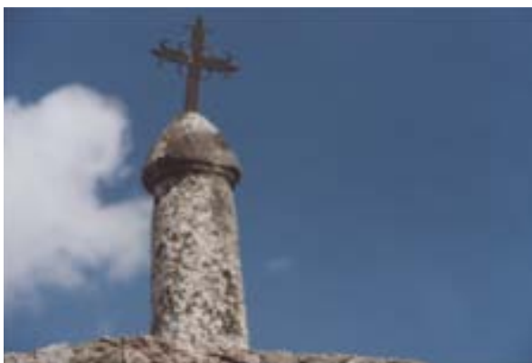
Segundo falo del calvario.