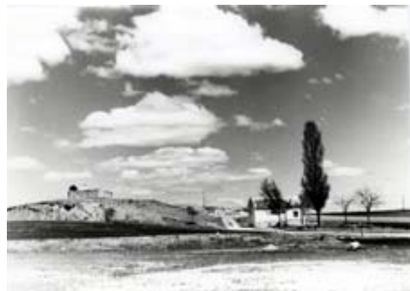
Vista panorámica del vía crucis con falos y cruces. Distribución de los falos anterior a la actual.