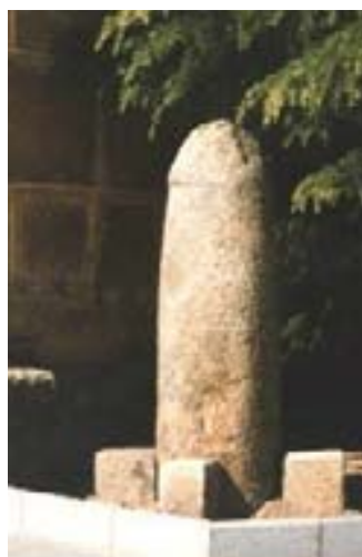
Falo romano de Rabanales junto a la iglesia.

Los falos hallados en la península ibérica consideramos que son de origen romano. Romanos son los falos de Ufones y Rabanales (Zamora), donde se han hallado diversos restos romanos y castros celtas. En Rabanales existen dos falos al lado de la iglesia, uno mayor que otro, el mayor de ellos tiene unos dos metros de altura. El de Ufones es de menores dimensiones y también se halla junto a la iglesia, lo cual nos hace pensar en que recibirían culto, pues es sabido que los cristianos levantaron sus templos en los mismos lugares donde antes se había practicado un culto pagano.