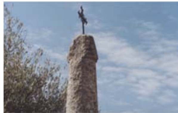
Cuarto falo del calvario que formaba parte del vía crucis campestre.