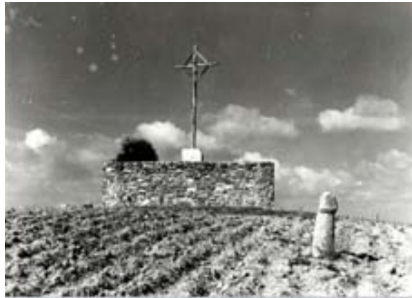
Vista panorámica del vía crucis con falos y sin cruces. Distribución anterior a la actual.