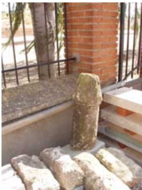
Falo procedente de la ermita de las tres culturas y guardado en una nave del ayuntamiento