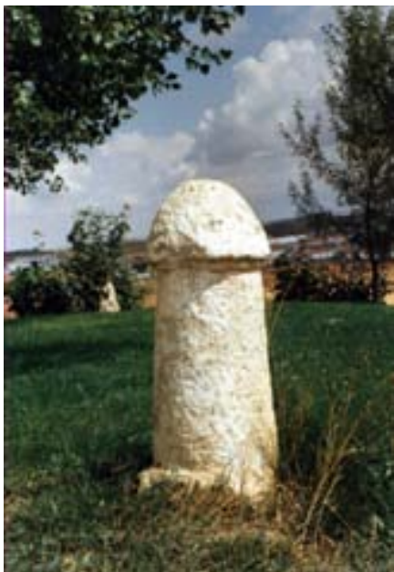
Falo final de vía crucis. Actualmente ubicado en una finca particular