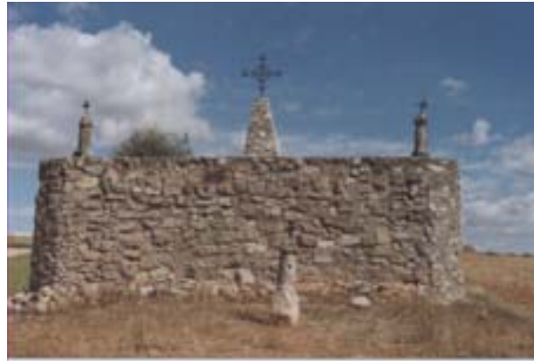
Vistas panorámicas del calvario con los falos. Situación actual