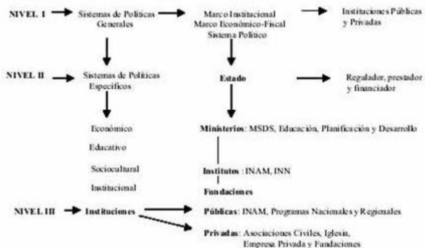
Diagrama 2 Marco institucional problema niños “de” y “en” la calle en Venezuela