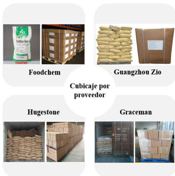
Ilustración 1 Cubicaje de proveedores destacados