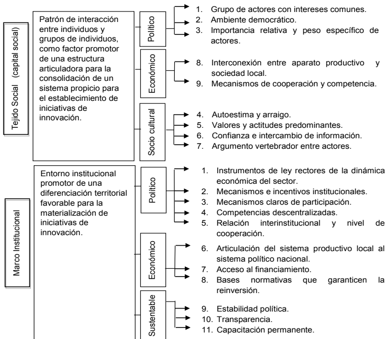
Diagrama 1 Contexto externo del sistema nacional de innovación local

En el diagrama 1, se describe el ámbito externo, las dimensiones y los indicadores que miden el proceso general de innovación local. En el diagrama 2, se describe el ámbito interno también con las dimensiones y los indicadores que según la investigación explican el proceso y forman parte de los componentes del sistema de innovación bajo los principios de desarrollo endógeno.