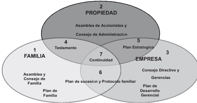
Gráfico 3 Estructura y planes de gobierno corporativo