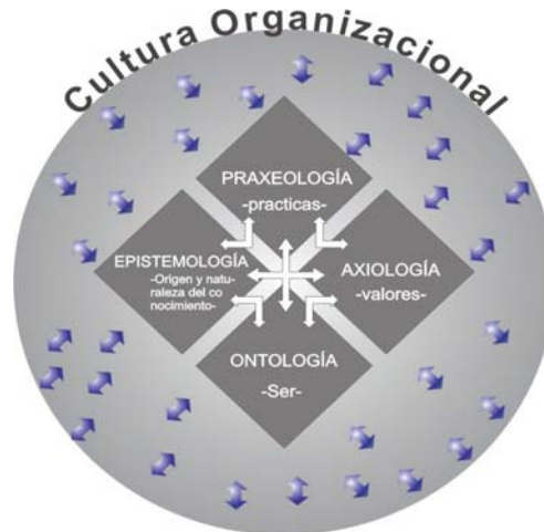
Gráfica 3. Interacción del rombo filosófico y la cultura organizacional