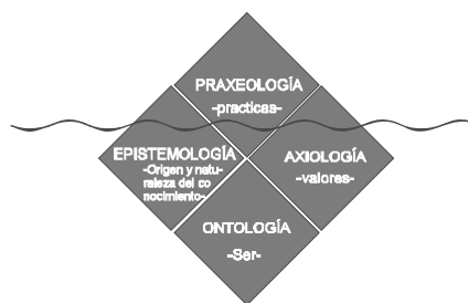
Gráfica 2. Rombo filosófico de Renée Bédard

Aunque se ha utilizado el "estímulo" para hacer referencia a las fuerzas que actúan en la cultura, no se toma en su definición literal, no se espera que a una