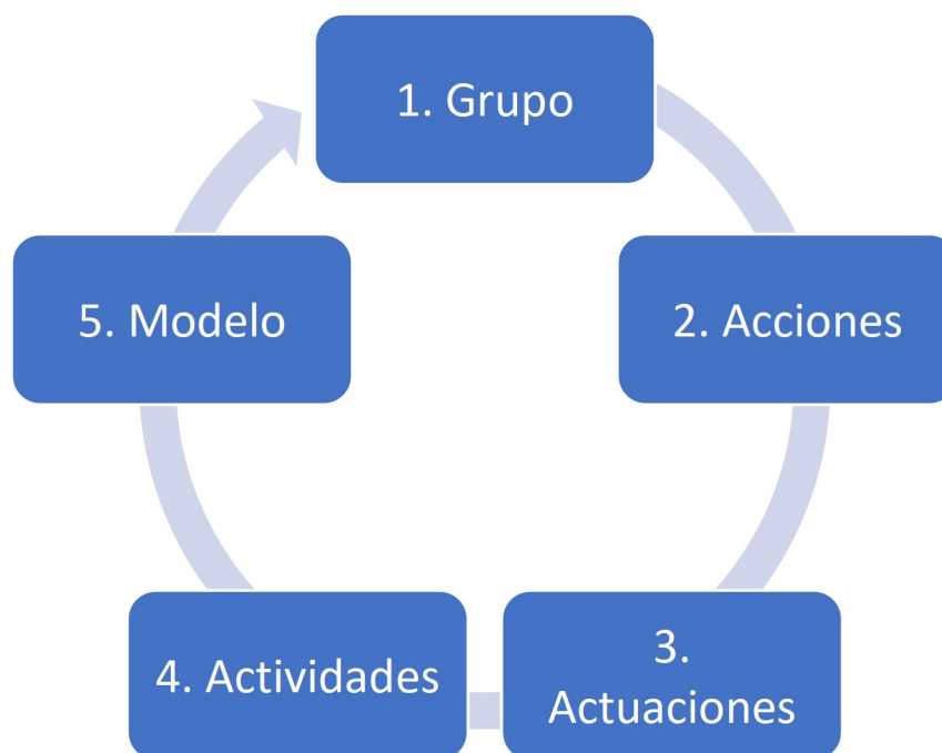
Figura 1. Características fundamentales de las políticas públicas (Adaptado de Aguilar-Villanueva, 2009).