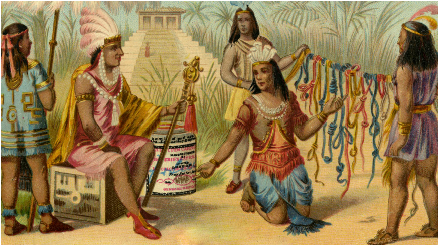
Fuente: Elaboración propia, 2026 tomada del Museo de la Nación del Perú. Figura 1: Representación del servinacuy en la sociedad incaica

para evaluar su compatibilidad, dinamismo y cooperación (ver Figura 1), que eran aquellos elementos esenciales en la economía agrícola colectiva del ayllu .