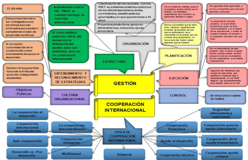
Gráfico 1. Estructura cognitiva Informante 1

la implementación de los acuerdos de paz firmados con el grupo guerrillero FARC-EP en la Habana Cuba, al respecto en el Gráfico 1, el informante 1 indicó que se siguen las directrices que vengan desde los Comandantes, que se deben ir implementando, mientras los Programas de Desarrollo con Enfoque Territorial (PDEP) llegan, también manifestó que hay acompañamiento de la alcaldía para la ayuda humanitaria, alimentaria, cultural, salud y educación, infraestructura, así como proyectos productivos.