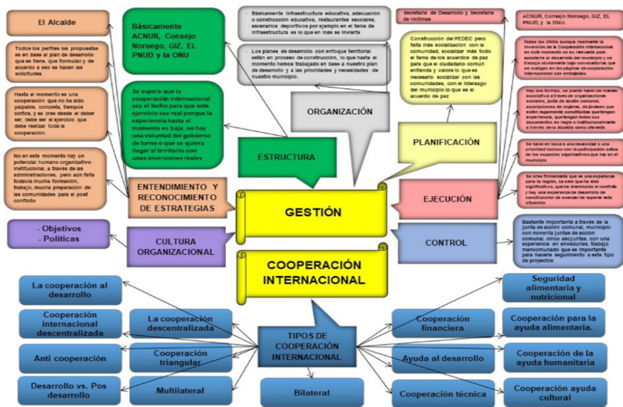
Gráfico III. Estructura cognitiva Informante 3

Se le consultó también cómo logra el municipio acceder a los recursos disponibles de cooperación internacional, por parte de las Organizaciones no Gubernamentales, Gestión, Proyectos, Urgencia Manifiesta, Actores, Todas las anteriores, a lo cual respondió todas las anteriores, aunque realmente la inversión de la Cooperación Internacional en este momento no es relevante para apostarle al desarrollo del municipio y se trabaja obviamente bajo convocatorias que se cuelgan en las páginas de cooperación internacional con las embajadas. A parte de ese tipo de cooperación que hay allí, hay unos temas como la Embajada de Turquía, Japón, Alemania, Canadá; por ejemplo, con esas embajadas se realizó la conexión luego de la firma de los acuerdos de paz, donde estas lo que hacen es unas ofertas y el municipio accede según las convocatorias que ellos tienen.