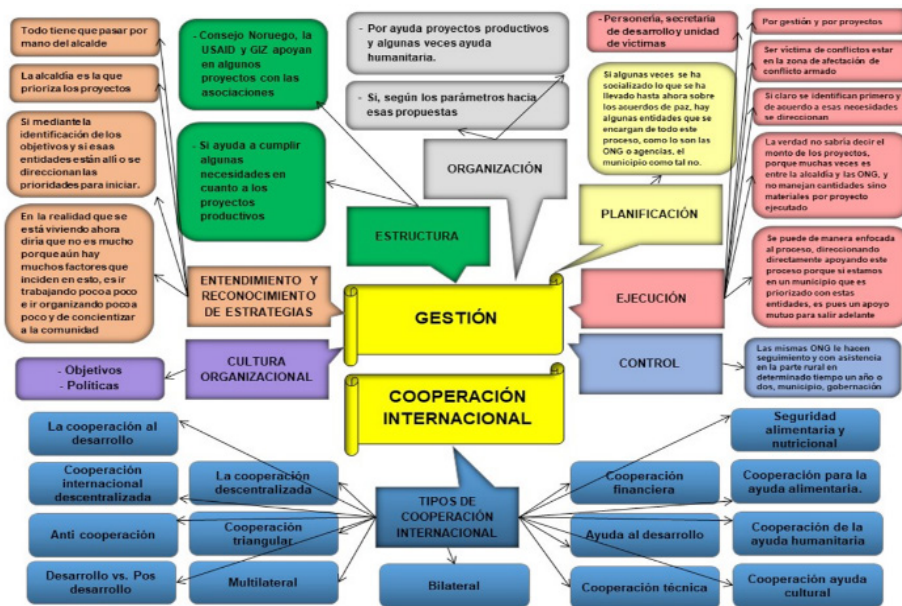
Gráfico IV. Estructura cognitiva Informante 4

En este sentido, también se le preguntó quién es el encargado dentro del municipio de aprobar los proyectos de cooperación internacional que están destinados para ser desarrollados dentro de la comunidad, el Alcalde, Personero Municipal, Secretario(a) de Desarrollo, Tesorero(a), Secretaría General, otro, a lo cual respondió que todo debe pasar por mano del alcalde.