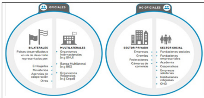
Figura I. Actores de la cooperación internacional