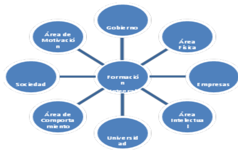
Figura 2. Engranaje Educación Empresarial Integral