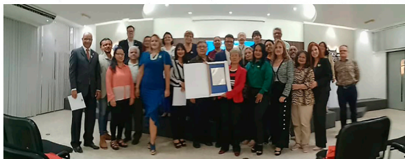
Personal docente, administrativo y asistentes al evento

Tres décadas conmemora la Maestría en Comunicación, como programa de posgrado que, desde 1994, ha contribuido a la formación científica y profesional de los egresados de la Universidad del Zulia. Con motivo de este aniversario, el pasado 25 de noviembre tuvo lugar un acto conmemorativo en el auditorio Darío Durán de la Facultad de Humanidades y Educación.