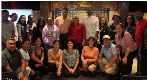
Asistentes a la actividad.

El pasado 6 de noviembre de 2024, un nutrido grupo de educadores, estudiantes y profesionales se congregó en el Teatro Baralt para participar en el conversatorio " Ecología, comunicación y participación ciudadana: construyendo un futuro sostenible ".