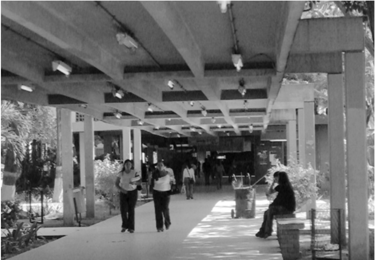
Figura 2. Eje de circulación longitudinal

dentro del proyecto original pasillo L, destaca por su diseño estructural conformado por los pórticos de hormigón a la vista que sostienen las placas que cubren el amplio corredor (figura 2). Este pasillo conecta, por el lado este con las funciones académicas de pre-grado que se desarrollan en los bloques A, B y D, sobre el mismo se encuentra el Bloque C destinado a las oficinas de los profesores y al oeste conecta con las funciones administrativas de decanato y post-grado, además de permitir el acceso directo a con la Plaza Humanística y consecuentemente con el andén cubierto del Terminal (figura 3).