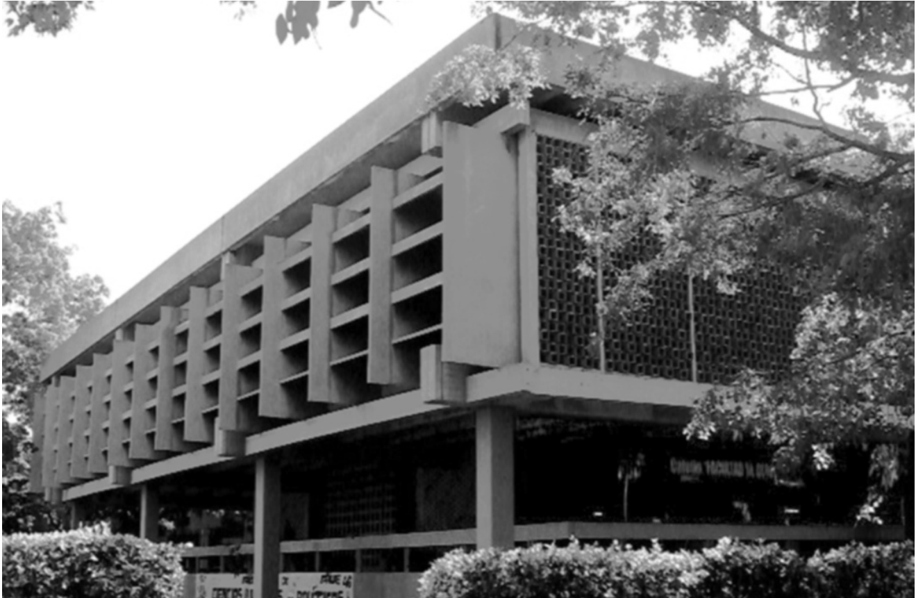
Figura 5. Vista del Bloque A