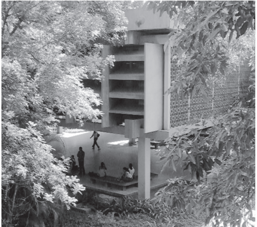
Figura 6. Vista del Bloque C con plaza cubierta

Otros elementos como el cuidado en los detalles de conexión entre los diferentes componentes de las fachadas: gárgolas, pantallas en las cubiertas, volados, accesos, entre otros, son