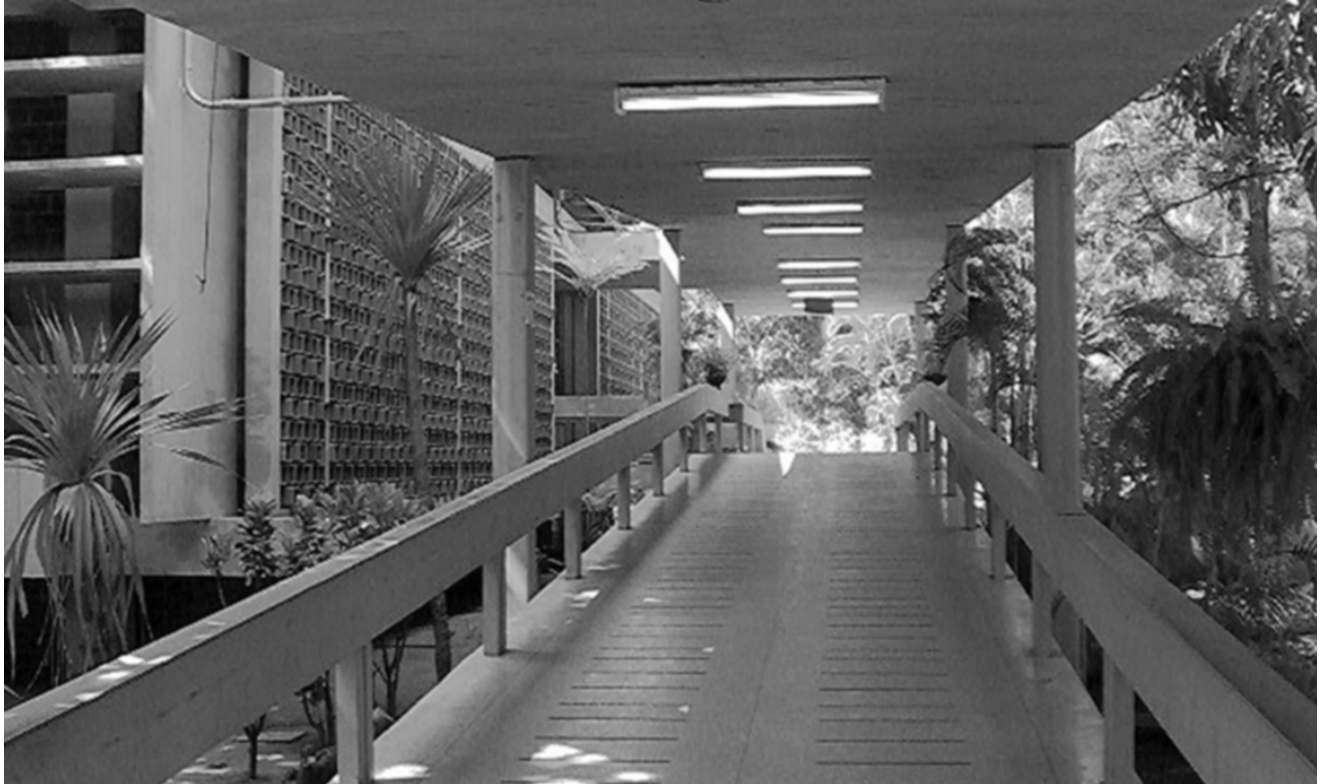
Figura 4. Circulación perpendicular