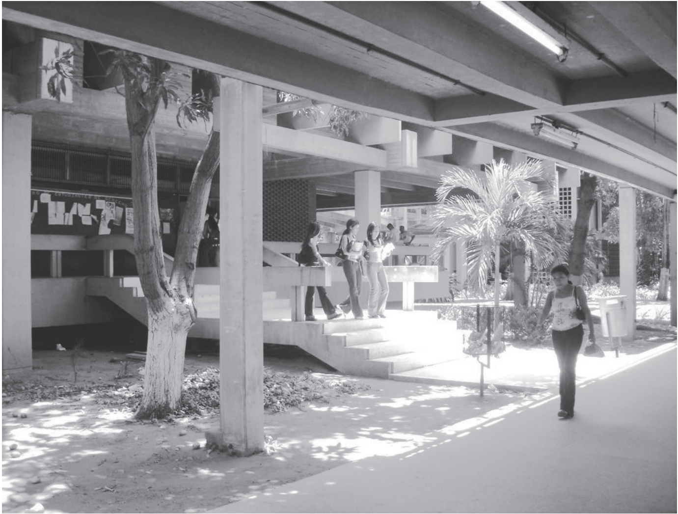
Figura 3. Conexión a las diferentes dependencias

unos 2,5 m para generar terrazas alrededor de su perímetro, se realizan con bloques de arcilla en obra limpia que se protegen de la incidencia del sol por las amplias cubiertas generadas por la planta alta. En los pisos superiores, sostenido por columnas, el bloque presenta en las fachadas este-oeste un tratamiento bioclimático por medio de una malla de quebrasoles horizontales y verticales que generan una modulación, expresan uniformidad y cuya profundidad protegen las ventanas internas de romanillas de vidrio. Las fachadas en sentido norte - sur son muros ciegos protegidos por bloques de arcilla perforados, separadas 60 cm de la pared, para dejar una cámara de aire que protege el interior de las inclemencias del clima local (figura 5).