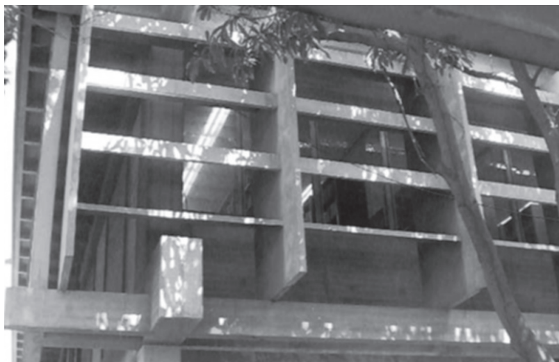
Figura 7. Detalle de los quiebrasoles

Previo al diseño se realizaron una serie de estudios y análisis, contenidos en el Informe Preliminar de la Junta de Planificación Universitaria, de 1962, que evidencia un proceso de reflexión, realizado por vez primera en la ciudad, y que se constituyen en una excelente fuente documental para la conformación de una teoría sobre la arquitectura moderna maracaibera.