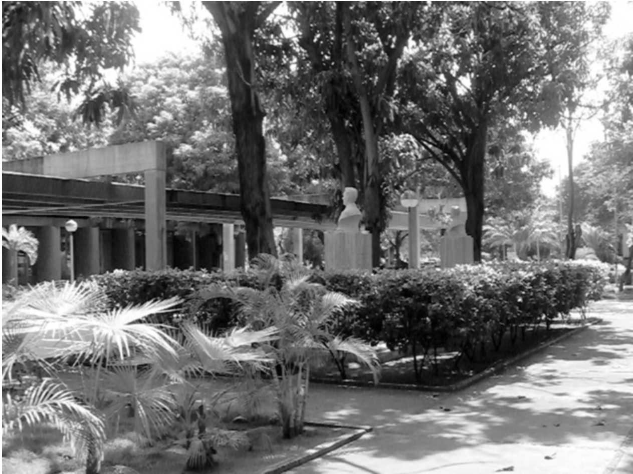
Figura 8. Incorporación de la vegetación. Adaptación al medio

Esta obra, junto con el resto del Núcleo Humanístico, representa uno de los ejemplos más importantes de la asimilación de la arquitectura moderna en la ciudad. Sus fachadas tridimensionales, el acabado en hormigón en bruto y la monumentalidad de su volumetría muestran la fuerte influencia del lenguaje derivado de la arquitectura de Le Corbusier, posterior a la Segunda Guerra Mundial, lenguaje que Nicolas Pevsner bautizó con el nombre de brutalismo.