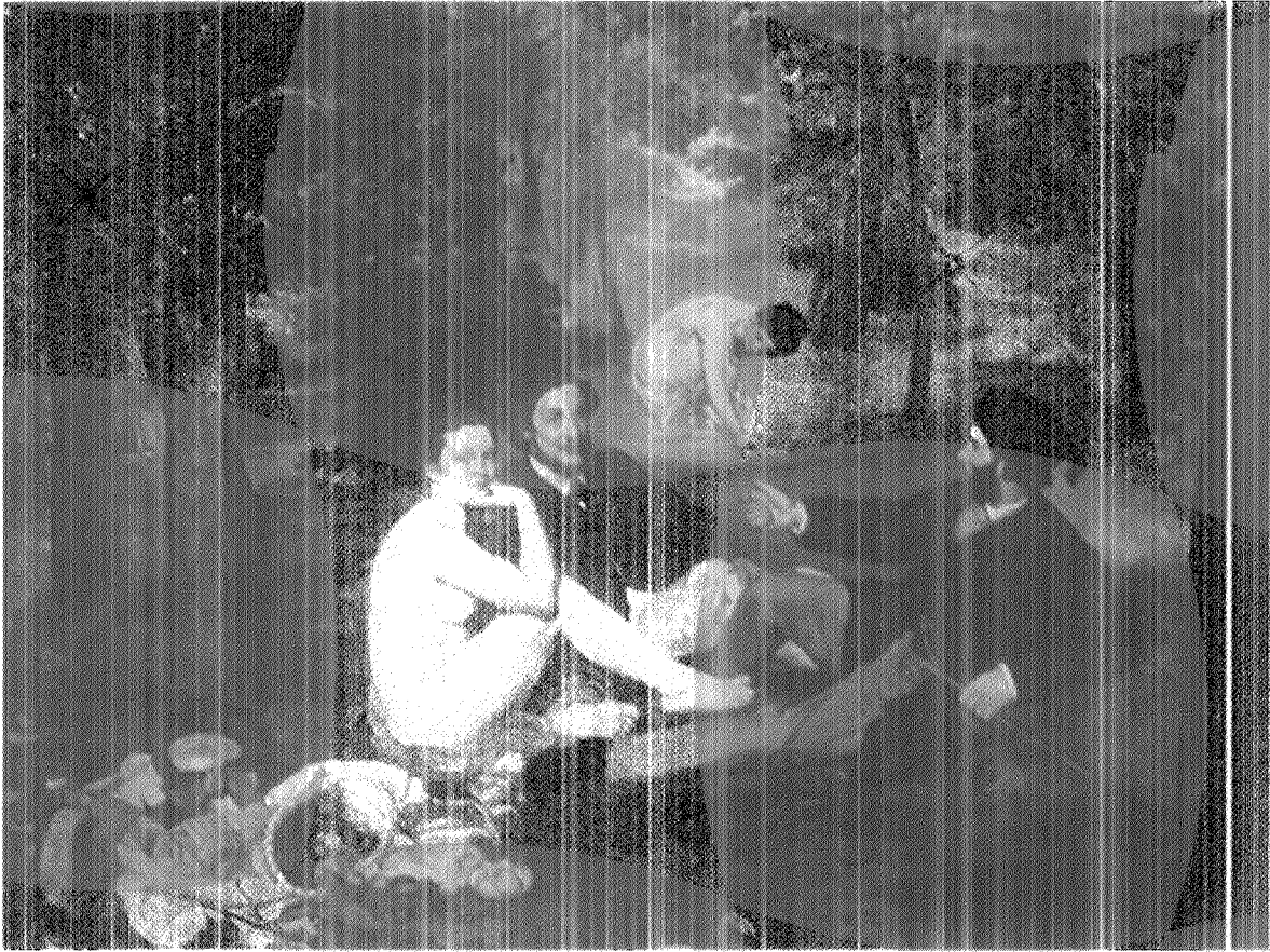
Figura 9 Edouard Manet. (1832-1883) "Almuerzo sobre la hierba" (1863) óleo sobre tela, 201 x 265 cm. En: Museo de Orsay. Colecciones. http://www.musee-orsay.fr/ (17/01/2001)

mide todo cuanto es capaz de ver y tocar, sin renunciar a intentarlo también sobre su psique, su imaginación, sus sueños. "No sólo todo el mundo siente que ocupamos un lugar en el Tiempo, sino que el más simple mide este lugar aproximadamente como mediríamos el que ocupamos en el espacio. (...) [Consideramos] la edad como cosa medible" (Proust 1998b:418). Así, hemos pensado lo impensable: el tiempo. Hemos vuelto lugar y cosa el rasgo humano, un invento. Lo convertimos en otro miembro más del universo cartesiano: homogéneo, lineal, constante.