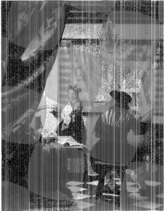
Figura 4 Johannes Vermeer. (1632-1675) "El artista en su estudio" (1665) óleo sobre canvas 120 x 100 cm. En: Los Grandes Museos de Europa. El Rijksmuseum de Amsterdam y otras colecciones . Acta producciones. cd-rom, 1999

en una instalación precaria: pero que, con todo y con eso, nos llena de alegría al verla llegar, porque sin ella, y reducida a sus propias fuerzas, el alma no lograría hacer habitable morada alguna! (Proust 1982a:13).