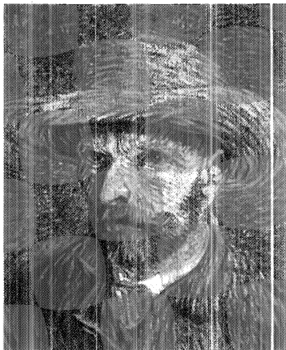
Figura 3 Vincent Van Gogh. (1853-1890) "Autorretrato de Van Gogh con sombrero de paja" (1887) óleo sobre canvas, 40.6 x 31.3 cm. En: The Vincent van Gogh gallery http://www.vangoghgallery.com/painting/p_0365v.htm (17/01/2001)

En consecuencia, este texto no se asume desde la aséptica estrategia con la que comúnmente se piensa a la ciencia, ni pretende "descubrir" ninguna