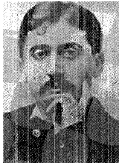
Figura 1. sin autor "Fotografía de Marcel Proust". En: The Kolb-Proust Archive for Research . University of Illinois at Urbana-Champaign. http://www.library.uiuc.edu/kolbp/Proust.htm (17/01/2001)

de Venezuela, este texto reúne reflexiones y comentarios que surgieron durante la lectura de la novela de Marcel Proust (figura 1), En búsqueda del tiempo perdido .