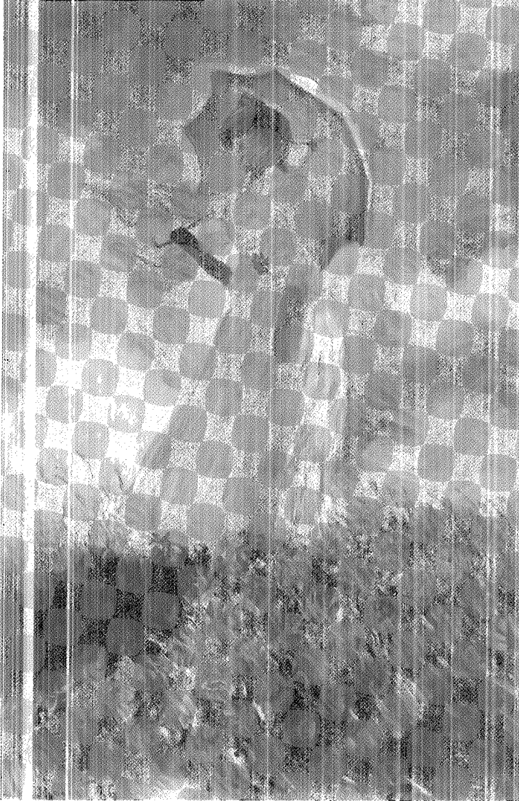
Figura 10 Claude Manet. (1840-1926) "Mujer con quitasol vuelta hacia la izquierda; estudio de figura al aire libre" (1886) óleo sobre tela. En: Los grandes Museos de Europa. El Museo de Orsay . ACTA producciones. CD-ROM, 1999

yacemos y nos mueve a levantarnos para devenir, junto a ella, en aire indómito, luz fracturada y amenaza de agua desprendida que regresará a la tierra, con ternura o con rabia, para despertar a las piedras.