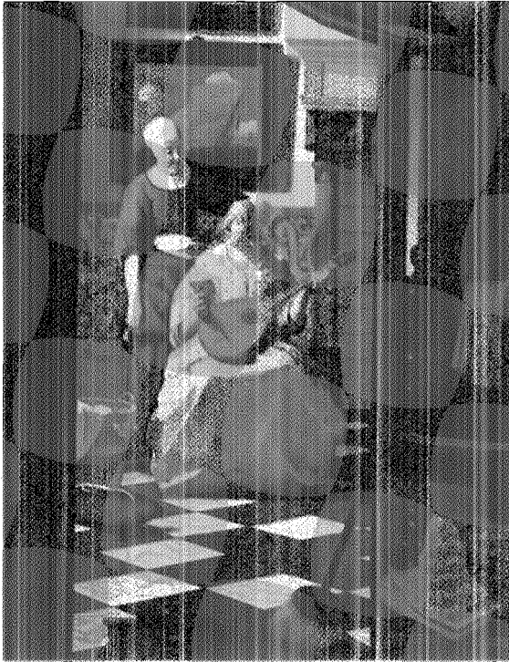
Figura 5 Johannes Vermeer. (1632-1675) "La carta de amor" (1668) óleo sobre canvas 44 x 38,5 cm. En: Los Grandes Museos de Europa. El Rijksmuseum de Amsterdam y otras colecciones . Acta producciones. cd-rom, 1999

permaneceríamos extáticos, rendidos ante tan maravillosa existencia. Pero, ¿realmente ha ocurrido la reunión con Dios, el retorno a Él ?