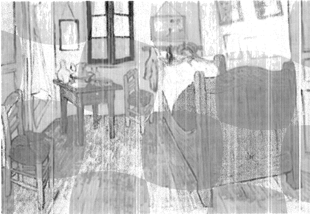
Figura 8 Vincent Van Gogh (1853-1890) "La habitación de Vincent en Arlés" (1888) óleo sobre canvas, 72 x 90 cm. En: The Vincent van Gogh gallery y http://www.vangoghmuseum.nl/ (17/01/2001)

del pintor, imposiblemente iluminada, recibe la luz que emana de su ser , a través de sus ojos; porque la luz existe dentro de él y por ella se crea el objeto que hará la mirada. Licht macht Feuer (la luz produce el fuego) citaría Bachelard a Novalis (Bachelard 1975:63). La luz del poeta crea el símbolo del fuego que otro, lejano, vigilante, solitario habrá de ver.