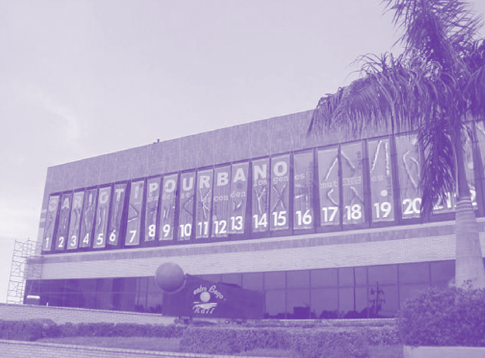
Instalación de Luis Gómez. Centro Lago Mall

propuesta. Por tanto, el espacio público determina su propia paleta tales como pinturas de exteriores y de demarcación de vialidad, sonidos, iluminación, propuestas digitales, impresiones gráficas con técnicas y acabados propios de señalización y publicidad, vegetación, sin olvidar los elementos más tradicionales como piedras, metales, concreto, etc