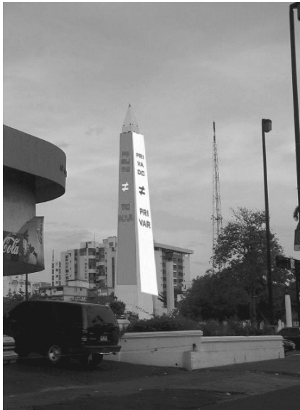
Instalación de Lourdes Peñaranda. Plaza de la República. (En proyecto)