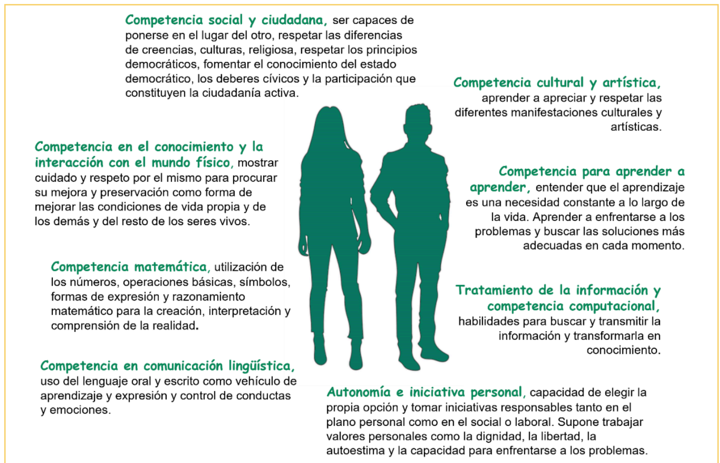
Figura 1. Competencias Básicas.

El Área Europea de Educación (European Education Area) definió en 2022 la competencia clave o básica como una combinación de destrezas, conocimientos y actitudes adaptadas a los diferentes contextos, sustentando la realización personal, la inclusión social, la ciudadanía activa y el empleo; por consiguiente, permiten a los individuos adaptarse a un entorno laboral cambiante, además de obtener buenos resultados durante la actividad profesional en diferentes dominios o contextos sociales. Constituyen, pues, la clave para la flexibilidad profesional o funcional de los trabajadores al posibilitar su movilidad, ya sea dentro de un mismo campo ocupacional o de un