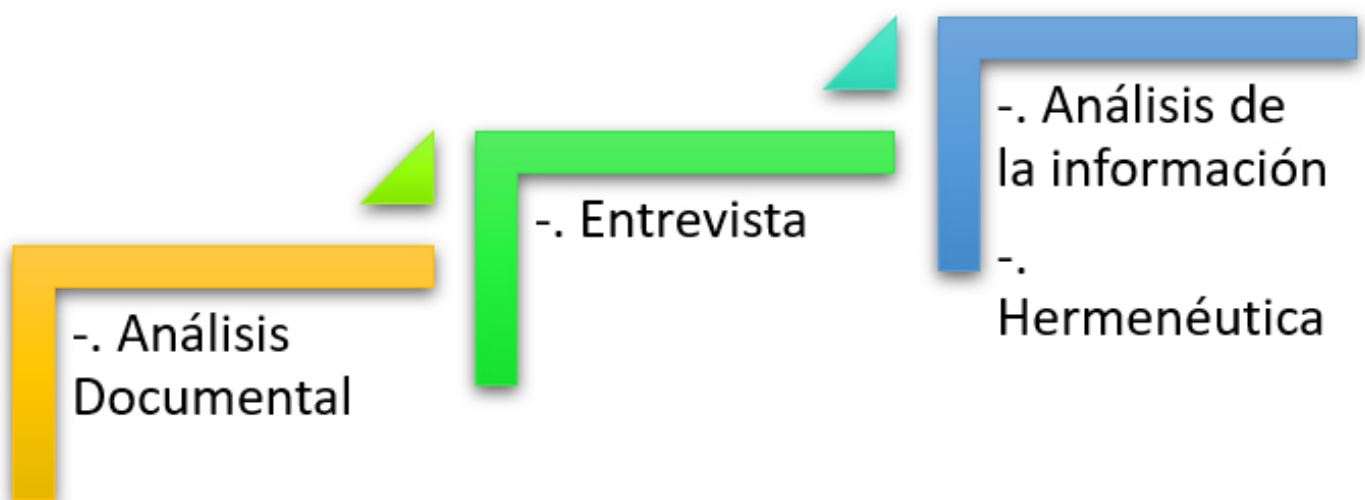
Gráfico 1. Fases del proceso investigativo para el desarrollo de competencias profesionales (Ortega, 2021).

Con la aplicación de esta metodología se profundizó en los datos recolectados, proporcionando riqueza interpretativa, contextualización del ambiente y detalles de experiencias únicas de los actores curriculares, aportando así un punto de vista integral de la problemática existente, dando lugar al diseño de la propuesta del presente estudio.