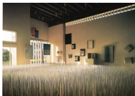
Fig. 4: Vista del interior de una de las salas del Museo, hacia 1973. En: Guevara, R. (1973).

1960. Será para el vigésimo cuarto aniversario del Museo cuando la imagen de algunas obras de artistas reconocidos internacionalmente reaparece en el catálogo conmemorativo.