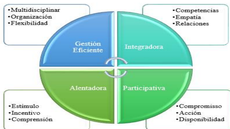
Figura 1. Conceptos y características del liderazgo femenino