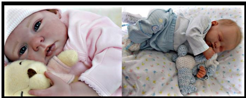
Figura 2. A la derecha, bebé reborn que se presenta como “agotado” en la página Web brasileña “Ana Reborn”

( https://www.bebesreborn.eu ), son blancos y de rasgos occidentales, además de reproducir los estereotipos asignados al sexo en cuanto a los nombres, colores (rosa, azul y blanco), adornos (lazos, diademas, gorros...), tamaño del bebé en función de sus sexo, accesorios (chupetes rosas, biberones azules...).