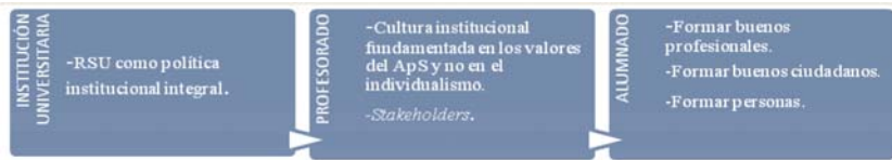
Figura 1. Visión acerca del ApS por parte de los responsables institucionales.

ner y proyectarse en la vida social, económica, política, ideológica y religiosa (en el caso de que se desee). Formar sujetos emprendedores, críticos con el establishment , pero también personas con capacidad de aprender a lo largo de toda la vida, para ir ajustándose a las demandas del entorno laboral, o incluso adelantarse a ella.