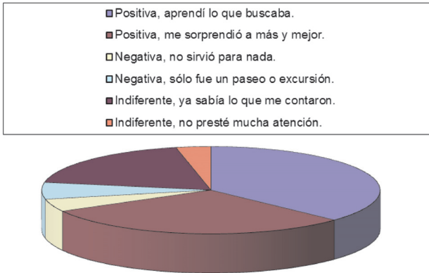
Figura 2. Opinión de los alumnos sobre la información obtenida en la visita realizada a la universidad

En cuanto a la información sobre la orientación y la Acción tutorial en la universidad, no hay diferencias entre el número de alumnos que conocen de la existencia del Programa de Acción Tutorial para el alumnado de nuevo ingreso pero sólo la mitad piensa solicitar la participación en dicho programa. Por último, es destacable mencionar que los alumnos consideran que es conveniente iniciar la orientación de la transición a la universidad en la Educación Secundaria Obligatoria.