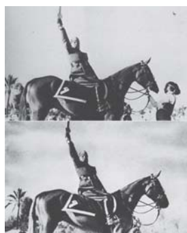
Fig. 2. Benito

tenía al animal para así no restarle poder al llamado Il Duce . Posteriormente, la Fig. 3 muestra que se eliminó a Alexander Malchenko del lado del líder soviético Lenin, quizás por haber caído en desgracia ante él; una práctica que luego mantuvo Joseph Stalin, quien en la Fig. 4 sale sin Nikolai Yezhov, eliminado de la foto por haber sido declarado traidor y ejecutado en 1940.