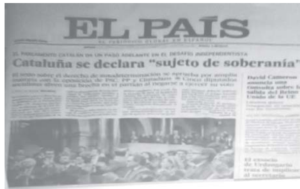
Fig. 9. La noticia que se quiso dejar en segundo plano, pasó luego a abrir el periódico con un titular cintillo a cinco columnas.

De hecho, esa fue la noticia que pasó luego al primer lugar, tras retirar la foto falsa del presidente Chávez (Ver Fig. 9). No obstante, queda la duda de si en primera instancia lo de la falsa foto no fue solo una cortina de humo, para restar importancia a ese suceso trascendental para esa región separatista, pues al fin y al cabo los medios son los agentes políticos por excelencia para darle vigencia a determinado régimen escópico. Por supuesto, sin menoscabar la evidente intencionalidad política e ideológica de añadir un acto más de agresión contra Venezuela y su gobierno de izquierda, para así ratificar la hipótesis inicial de que los medios de difusión masiva utilizan su poder para imponer ciertas maneras de ver en la sociedad, para garantizar la reproducción de su ideología y de ahí que se valgan de cualquier estrategia para imponer y darle vigencia al régimen escópico dominante que, como tal, responda a sus intereses particulares en determinado momento histórico.