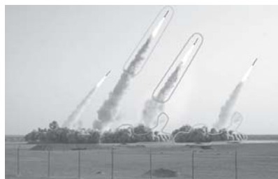
Fig. 8. La figura retórica de la reiteración se aplicó en este caso de los misiles iraníes.