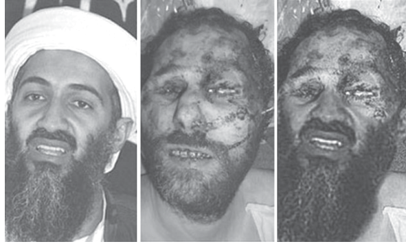
Fig. 5. Foto trucada de Bin Laden.