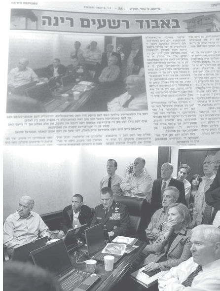
Fig. 6. En este periódico israelí no publican fotos de mujeres, por ser “sexualmente sugerentes”.

También la candidata republicana, Sarah Palin, fue afectada por un fotomontaje inspirado en sus posiciones ultraconservadoras, cuando durante la campaña presidencial de 2008 la hicieron aparecer en bikini (con los colores de la bandera estadounidense) y con un rifle de asalto, según se aprecia en la Fig. 7. Igualmente, los medios iraníes pusieron a circular una foto de presuntas varias pruebas misilísticas con fines de disuasión contra Estados Unidos e Israel, aunque luego se detectó que solo eran fotos retocadas donde el mismo misil aparece repetido (ver Fig. 8).