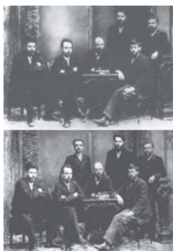
Fig. 3. Lenin también manipuló las fotos para que solo se viera lo que el gobierno quería.