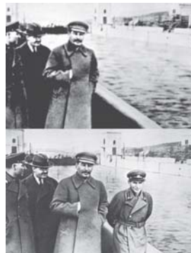
Fig. 4. Stalin mandó a eliminar la foto de un traidor que paseaba a su lado por el Canal de Moscú.

Esa tendencia de trucar las fotos que se aprecia en la prensa se pierde de vista en la actualidad, con la existencia de programas computacionales como el Photoshop, que permiten recrear realidades ajustadas a la medida de los intereses de los medios de difusión y de las sociedades o estados a los que sirven. En la Fig. 5 aparece la foto que circuló por los medios internacionales como la del presunto cadáver de Osama Bin Laden, pero luego se descubrió que fue una modificación de la foto de otra víctima. Para esa fecha de la muerte de Bin Laden, el periódico israelí “Der Tzitung” eliminó de la foto de su primera plana a la entonces secretaria de Estado de Estados Unidos, Hillary Clinton, y a la analista Audrey Thomason, aunque en esta ocasión no fue en rechazo a ambas, sino porque su política es no publicar imágenes femeninas por considerarlas “sexualmente sugerentes”.