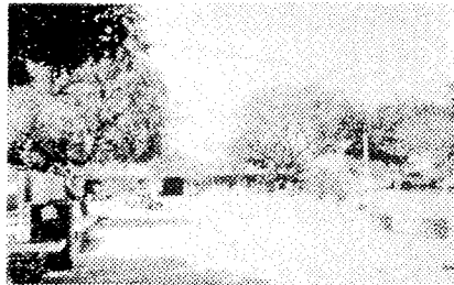
PLAZA SECTOR 9

Las plazas interiores Plazas con radio de incidencia vecinal o parroquial, insertadas dentro de zonas residenciales con dimensiones menores a 2500 metros cuadrados.