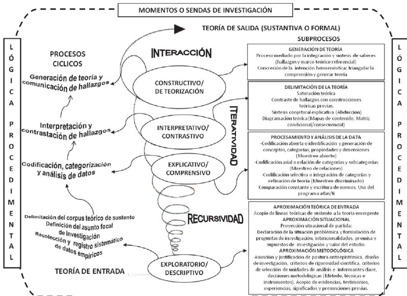
Figura 2. Sistema metodológico de investigación.