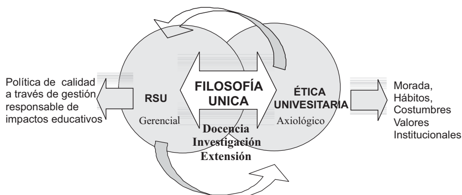
Figura 1. Relación de RSU y Ética.

Por ello, para la universidad la ética y la responsabilidad social constituyen el engranaje axiológico que fusiona las actividades de docencia, investigación y extensión en función del desarrollo de las acciones que van más allá de la proyección social, con el fin de posibilitar la pertinencia y el compromiso social con la solución de los problemas sociales y la formación social en los saberes y competencias, el mejoramiento y el emprendimiento.