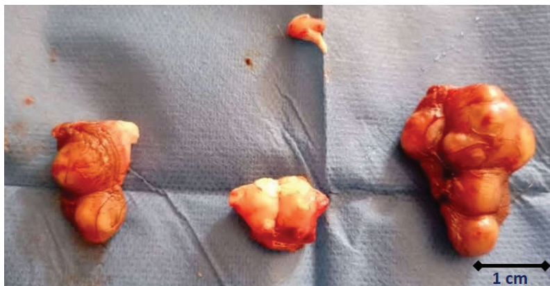
Fig. 4. Escala de las lesiones descritas por el Departamento de Anatomía Patológica. Macroscópicamente se reciben 3 fragmentos de piel, el mayor mide de 3.8x2 a 1x0.9cm y el menor mide 2x1.5cm, con una superficie cutánea de color pardo claro, observándose múltiples lesiones nodulares entre 0.6 y 1.4cm, redondeadas y de consistencia dura, la superficie de corte es sólida y blanquecina.

Los nódulos generalmente crecen lentamente en años o décadas, pero en múltiples reportes de casos, se han desarrollado rápidamente en meses 7 . El tamaño de los nódulos varía desde varios milímetros hasta el más grande reportado de 7 cm. La recurrencia es poco común, aunque se han reportado 4 pacientes que han presentado recurrencia luego de la extirpación 4 .