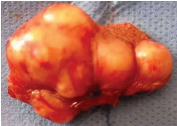
Fig. 3. Ejemplo de nódulo resecaado.