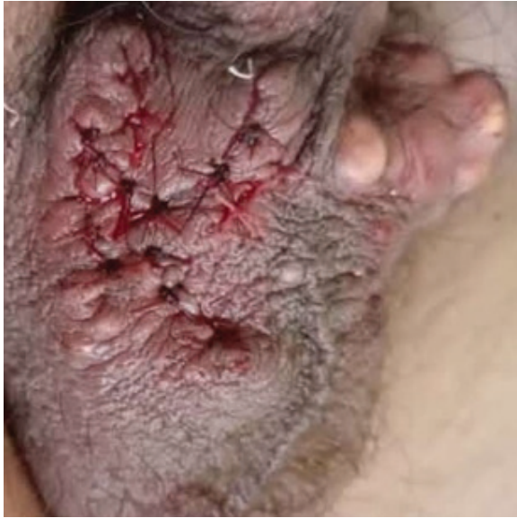
Fig. 2. Incisión elíptica, posterior a exceresis de cada lesión.