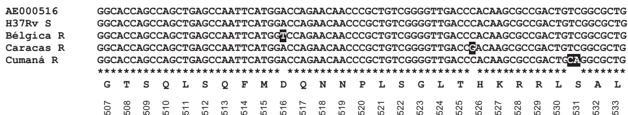
Fig. 2. Comparación de las secuencias de la región determinante de resistencia a rifampicina del gen rpoB de M. tuberculosis de la cepa resistente y las de referencia comparadas con una secuencia del GenBank (Accession Number: AE000516). La numeración mostrada es según Telenti y col. (27).

En el estudio se observó una menor concordancia para la estreptomycin, por la prueba de nitrato reductasa. Al respecto, Angeby y col. (17) en su estudio empleando la prueba Nitrato Reductasa, señalaron la dificultad que se les presentó al evaluar la especificidad (83%) de resistencia a la estreptomycin y la sensibilidad (75%) en la detección de resistencia al etambutol. Lemus y col. (23), al utilizar la prueba de Nitrato Reductasa obtuvieron una sensibilidad de 91,7%; 96,5%; 88,0% y 93,9%, y una concordancia de 97,0%; 92,0%; 92,0% y 99,0% para isoniazida, estreptomycin, etambutol y rifampicina, respectivamente; acotando que los resultados de su estudio son prome-