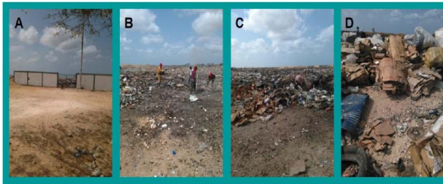
Figura 3. Detalles del vertedero a cielo abierto del municipio Los Taques. A: entrada del vertedero, B: personas recolectoras de residuos, C y D: basura dispuesta en el vertedero. Elaboración propia.

En el vertedero a cielo abierto se encuentra un cierto número de personas recolectoras de materiales (Figura 3), quienes revisan y escudriñan entre la basura descargada para recoger los que son de su interés, quemando frecuentemente los que consideran no aprovechables.