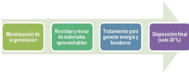
Figura 5. Prioridades para la gestión integrada de desechos y residuos sólidos (Kiely, 1999).

La gestión integrada de residuos sólidos implica un conjunto de planes, normas y acciones coordinados, cuya finalidad es que todos los componentes de la basura puedan ser manejados de manera amigable con el ambiente, con tecnología adecuada a costos razonables y de forma socialmente aceptable (Kiely, 1999; Luy, 2014). En la Figura 5 se incluyen las prioridades para la gestión integrada de desechos y residuos sólidos en las comunidades: 1) Minimizar todas las fracciones de los componentes, 2) Reciclar todo lo posible de cartón, papel, vidrio, metales no ferrosos y productos textiles, 3) Reutilizar plásticos, metales ferrosos y vidrio, 4) Convertir a biogás o bioabono las fracciones orgánicas, 5) Incinerar solo los plásticos o alimentos restantes y 6) Evacuar a vertedero solo el 20 % restante (Kiely, 1999). Esta perspectiva ha sido tomada como insumo para la propuesta del presente trabajo.