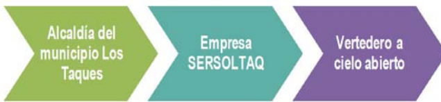
Figura 2. Esquema de actores y responsabilidades en el manejo actual de residuos sólidos de la comunidad de Amuay. Elaboración propia.

De acuerdo con la información suministrada por la empresa SERSOLTAQ, se recolectan aproximadamente 5 toneladas de basura doméstica dos veces por semana en Amuay, pasando los camiones solo por la calle principal y algunas adyacentes de la comunidad. Estos materiales luego son dispuestos en el vertedero a cielo abierto ubicado en la vía entre Guanadito y Nueva Jayana, en el cual se disponen los residuos domésticos de todas las comunidades del municipio Los Taques. El resumen de los autores y responsabilidades en estas actividades, se presenta en la Figura 2.