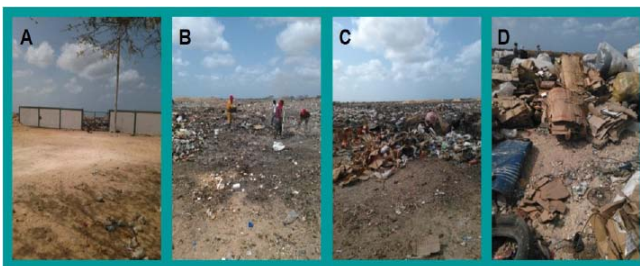
Figura 4. Detalle de labores realizadas por la cooperativa Vertedero Plis. A, B y C: sistema de empaclado de residuos para comercialización, D: carga de camión con residuos. Elaboración propia.

También hace vida en el vertedero una cooperativa llamada Vertedero Plis, la cual se dedica a la clasificación, recogida y comercialización de materiales específicos seleccionados de la basura. Dicha cooperativa tiene un personal que se dedica a la clasificación manual de los mismos, de acuerdo a ciertos sus criterios de comercialización, como: tipo de material, color, estado, entre otros, permitiendo obtener un beneficio económico de esta actividad (Figura 4). Para el transporte y comercialización de los materiales seleccionados se usan grandes sacos que permiten su traslado en camiones hacia la ciudad de Barquisimeto, donde tienen los convenios de compra-venta.