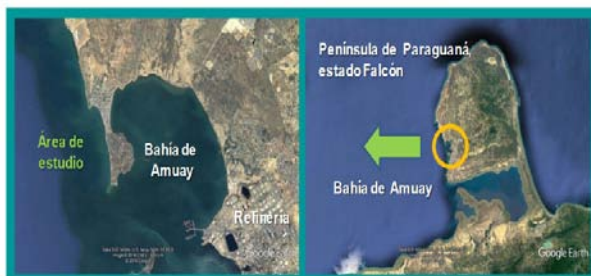
Figura 1. Ubicación de la zona de estudio, costa Oeste de Amuay, estado Falcón. Elaboración propia.

Esta zona presenta una importante actividad pesquera, tanto artesanal como industrial, siendo el principal sustento económico de sus pobladores y desarrollándose particularmente en los sectores de Las Piedras y Amuay. El turismo y la recreación también encuentran en esta bahía ambientes propicios para los deportes acuáticos y eventos de esparcimiento, ya que cuenta con hermosas playas y áreas de restaurantes y servicios básicos para los visitantes (INEA, 2011).