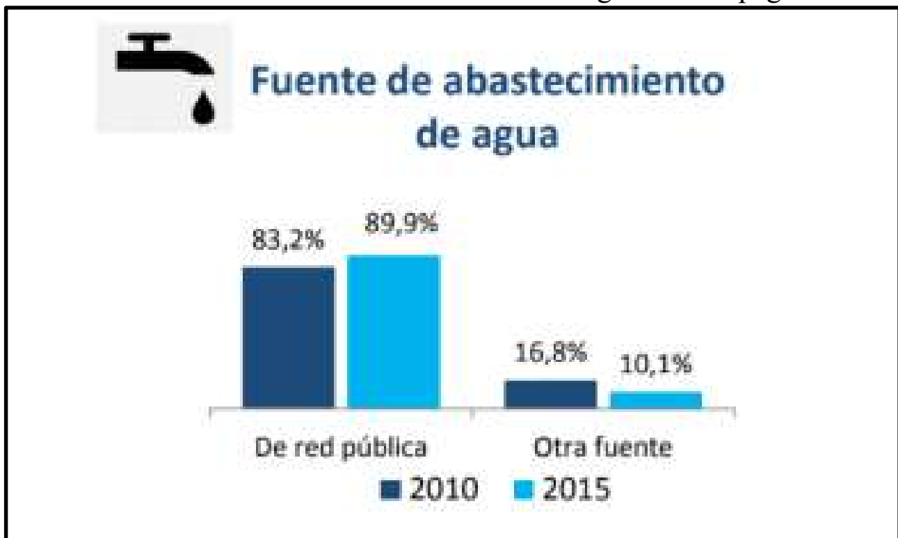
Gráfico 1. Sistema de abastecimiento de agua en Galápagos

En esta misma línea se concentra el criterio de la medición de la pobreza por NBI. Recordemos que para el 2010 de acuerdo con el INEC el 40,4% de la población vivía con inadecuados sistemas sanitarios, es decir, con precarias condiciones de abastecimiento de agua mediante red pública, y eliminación de excretas mediante el alcantarillado. La realidad de la provincia con respecto a la provisión de este servicio básico, se ve reflejada en las siguientes cifras: