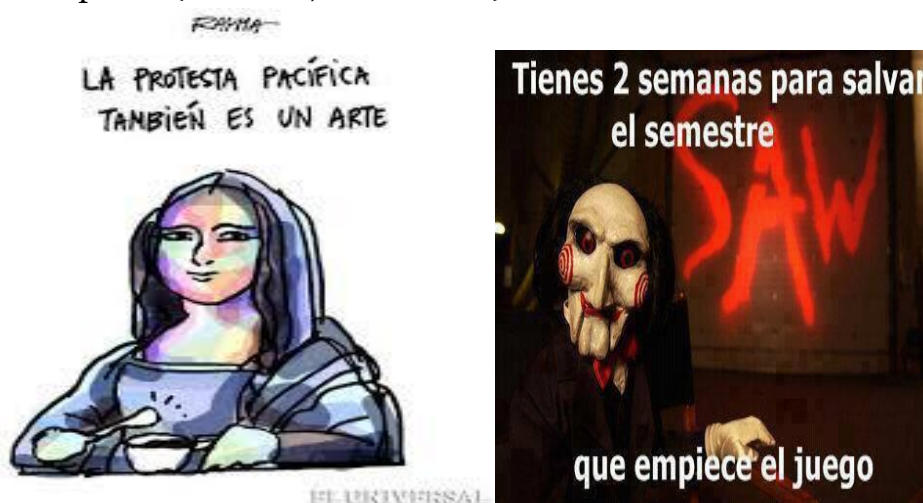
Figura 2.- Uso de imágenes y textos con imágenes

Se constituyen en una adaptación de las estrategias utilizadas por Vélchez (2005) y Lacon y Ortega (2008) y Franco (2004), las cuales tienen como propósito el uso del saber de la lengua, del mundo y de la cultura que utiliza el estudiante para poder comprender y producir un texto escrito. En el caso del modelo lingüístico-cognitivo se utilizan imágenes que estén en relación con acontecimientos y temas relacionados con la realidad del estudiante, como por ejemplo imágenes alusivas al proceso social y político que actualmente vive el país, así como acontecimientos de fuerte impacto. (Villasmil, 2012. P 226)