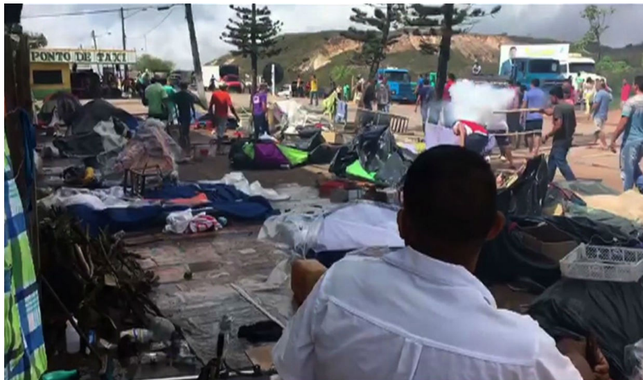
Figura Número 4