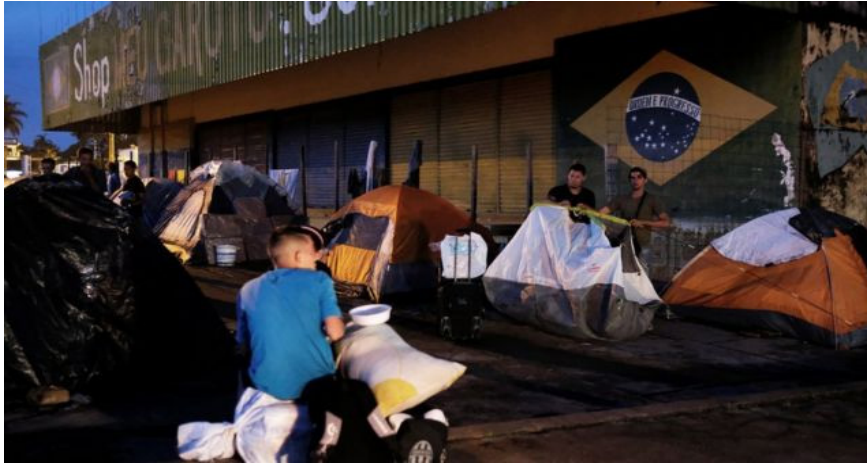
Figura Número 3