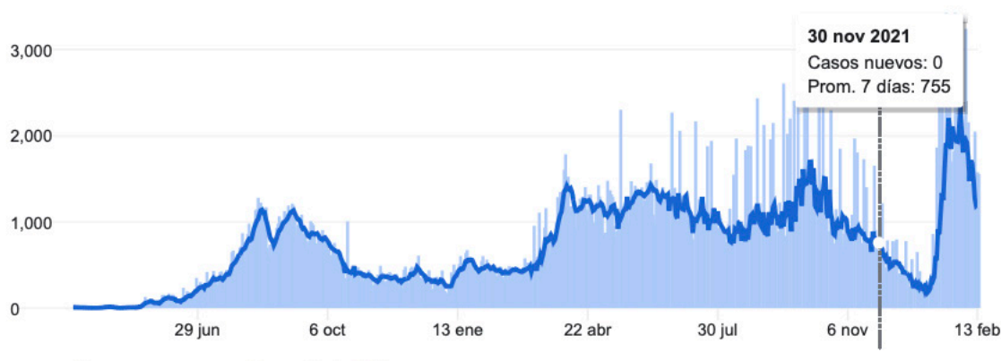
Figura 2: Evolución de los casos positivos reportados oficialmente Período marzo 2020 – noviembre 2021

Fuente: Google reporte SARS COVID-19 (2022): Casos confirmados y probables, los funcionarios de los servicios de salud pública identifican los casos probables según los criterios establecidos por las autoridades gubernamentales.