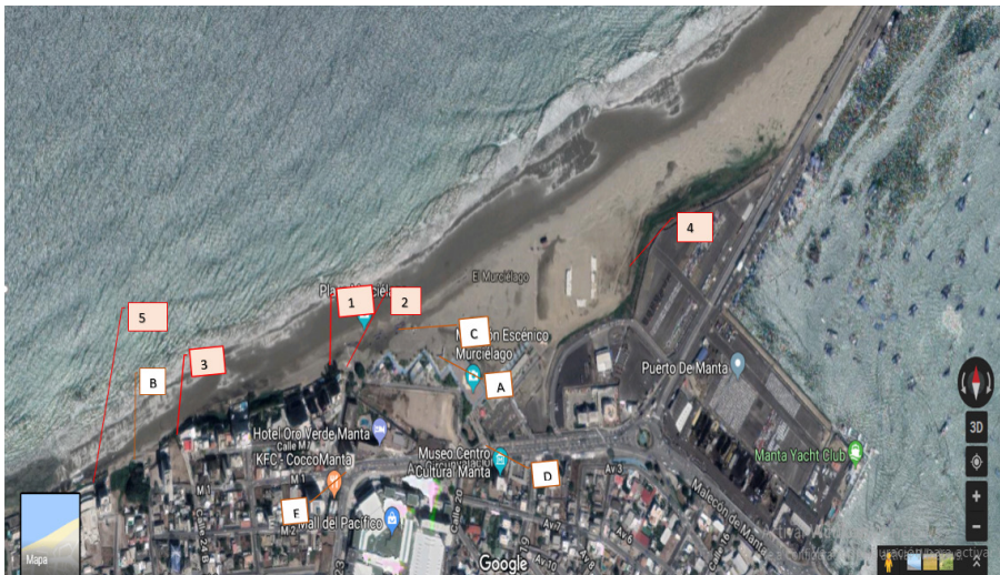
Figura 2. Diciembre, 2017. Distribución de hotspots en el mapa y su leyenda. Rosado: hotspots saturados. Café claro: no saturados pero que, en conjunto, inciden en dinámicas.