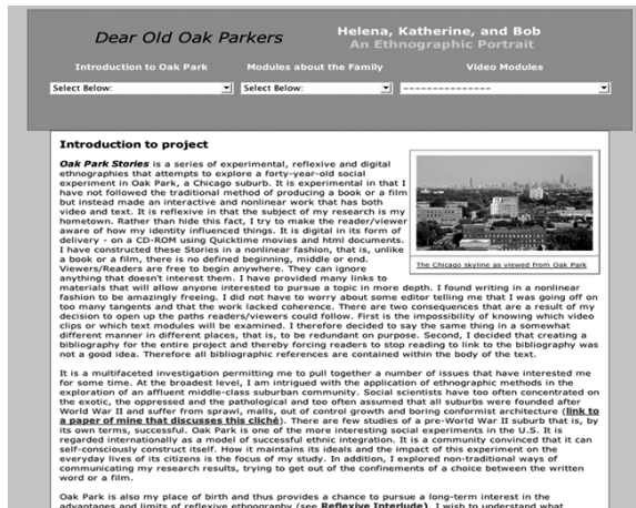
Figura 2 Diseño global