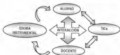
Figura 1. Interacción didáctica del Inglés Instrumental mediada por las TICs.

colaborar en clases virtuales, foros y chats con colegas de otras latitudes. A manera de ilustración, se puede observar en la Figura 1, la interacción de la acción didáctica del Inglés Instrumental.