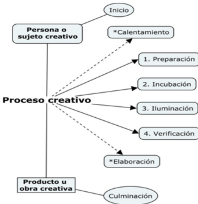
Figura 1. Diagrama de flujo del proceso creativo

f) Elaboración: se materializa y socializa el resultado final del pensador; el proceso creativo da paso al producto final, obra, idea, actividad o conocimiento.