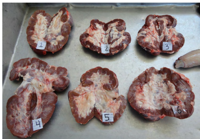
FIGURA 2. Riñones de los 6 animales machos bufalinos, positivos en serología y cultivo a leptospira, mostraron nefritis intersticial crónica, focal con cambios sugestivos de mineralización en túbulo colectores, producto de infección bacteriana