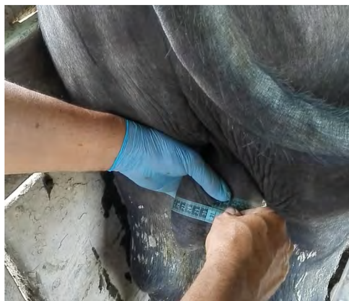
FIGURA 1. Medición de Circunferencia Escrotal (CE) en pie en machos bufalinos

De un total de 6 animales positivos a MAT, cultivo bacteriológico de semen y orina, postmortem , se extrajeron riñones, testículos y epidídimo para el examen histopatológico y el cultivo bacteriológico de tejido. Para el examen histopatológico se tomaron muestras representativas de cada uno de los seis casos referidos. Luego de fijados testículos, epidídimos y riñones en formol al 10%, se enviaron a la Unidad de diagnóstico anatomopatológico "Dr. Gustavo A. Bracho V", Laboratorio Biovet, Barquisimeto, Lara, Venezuela para su evaluación. (FIGS. 2 y 3).