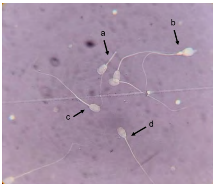
FIGURA 5. Morfología espermática (a) cola flexionada, (b) gota citoplasmática proximal, (c) vivo, normal (d) muerto