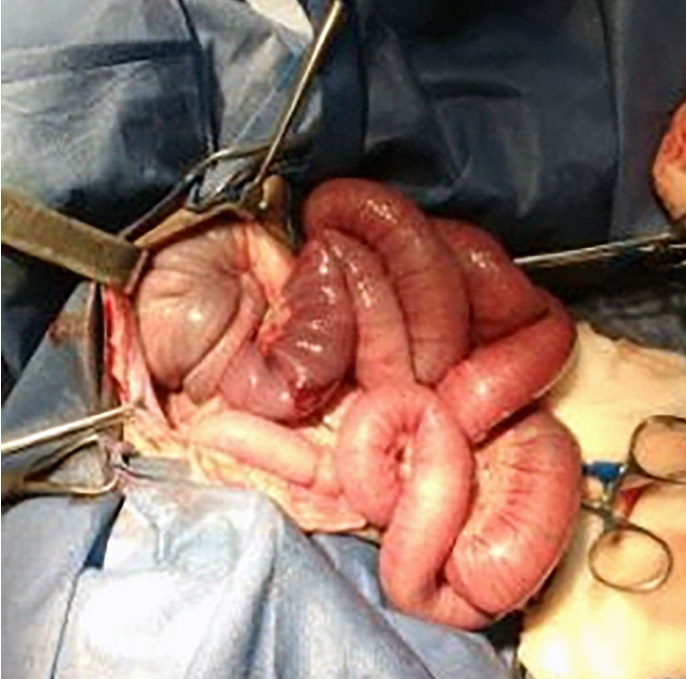
FIGURA 2. Reducción de la intususcepción por vía abdominal

Se realizó maniobra para reducir el intestino por la zona abdominal sin respuesta alguna, por lo que se realizó reducción por zona perineal por parte del cirujano, mientras que el ayudante hizo la reducción por zona abdominal (FIG. 2).