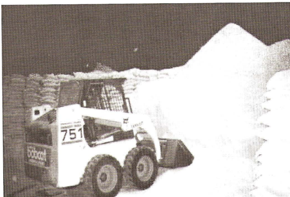
FIGURA 1. DEPÓSITO DE MATERIA PRIMA DE DONDE SE RECOLECTARON LAS MUESTRAS.

Inmediatamente, se procedió a realizar una serie de cinco lavados de los micropozos con agua deionizada. El remanente de agua que pudiera quedar en los micropozos fue eli-