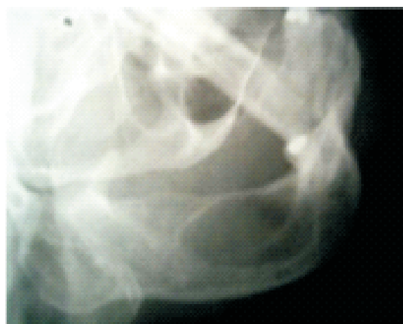
Figura 1. Vista lateral oblicua del cuerpo mandibular del lado derecho, donde se delimita claramente 1 imagen radiolúcida con bordes definidos, sin relación apical con el 34.

gía de La Universidad de Los Andes, con la finalidad de consultar diagnóstico presuntivo. Refiere que tiene una data de 2 años y que alguna vez en una cita odontológica le hablaron de esta lesión. Al examen clínico presenta ausencia dentaria del 35, 36, 37, 38, 45, 46, 47 y 48. En la zona vestibular del lado derecho no se observa aumento del tejido y por lingual un leve aumento que solo es detectable cuando hay palpación profunda. Se decide verificar el diagnóstico tomando una radiografía lateral oblicua, la cual arroja una cavidad radiolúcida de 3 cm. de longitud por 1,6 cm. de altura, con bordes escleróticos bien definidos y sin relación aparente con el 34, como se observa en la Figura 1. Aunque la lesión continuaba asintomática, la amplitud de la lesión, su localización, edad del paciente, clínica, no correspondía con un quiste radicular. Esta claramente demostrado, que en ocasiones es posible que el clínico tenga ciertas discrepancias en cuanto al diagnóstico definitivo de una cavidad quística en particular, en vista de la gran variabilidad de lesiones de este tipo, descritas en el sistema maxilo facial. El diagnóstico presuntivo correspondía con un quiste residual, sin embargo, sería completamente corroborado cuando se