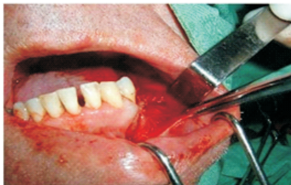
Figura 2. A la izquierda ventana ósea a la derecha apertura de la lesión.

Expuesta la lesión en su totalidad, se realiza la correspondiente enucleación, se procedió a la colocación de anestesia mandibular con subsiguiente lavado profuso de la zona con suero fisiológico y colocación del Apafill G para este caso en particular, en vista de su extensión se utilizó 0,1-0,4 \mu\text{m} de diámetro. Previa esterilización del material y combinándolo con solución fisiológica se comienza a obturar la zona (Figura 3); posterior a la obturación se cierra el colgajo (Figura 4) indicándosele medicación y cuidados postoperatorios respectivos. Es importante resaltar, que no hubo complicaciones infecciosas ni exfoliación del material a pesar del tamaño de la lesión. A los seis meses se realiza control radiográfico observándose regeneración ósea