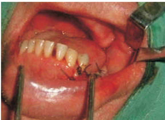
Figura 4. Sutura de la zona.

apropiada, a pesar de que la cavidad quística era de un tamaño considerable como se muestra en la Figura 5.