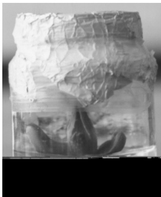
Figura 2. Regeneración en Aloe vera L. a partir de yemas apicales. Edad 30 días. Medio de cultivo 2. Tratamiento 3.