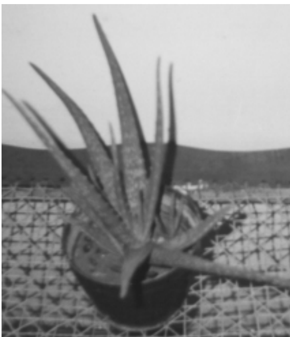
Figura 3. Planta adulta de Aloe vera L. obtenida in vitro . Edad 5 meses. Medio de cultivo 2.

El medio utilizado para enraizamiento es el medio Murashige y Skoog sin hormonas, ocurriendo esto en aproximadamente 10 días.