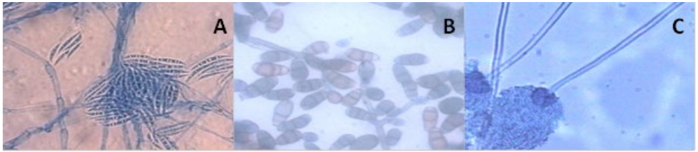
Figura 3. Principales géneros fúngicos aislados en carga aérea. A) Fusarium sp., B) Curvularia sp., C) Aspergillus sp. Tinción con azul de algodón de lactofenol, aumento objetivo 40X.

Durante el primer muestreo (época de sequía), se obtuvieron cinco atletas negativos para crecimiento fúngico micelial, en tanto que seis fueron positivos y cinco se encontraban medicados con antialérgicos y síndromes gripales permanentes. Los géneros encontrados fueron Stachybotrys sp. (un atleta), Aspergillus sp., (cinco atletas), Fusarium sp., (dos atletas), Curvularia sp., (dos atletas), Alternaria sp., (dos atletas) y Fonsecaea sp., (un atleta). Durante el segundo muestreo (periodo de lluvia), se registró la presencia fúngica micelial en nueve de los 11 atletas evaluados, encontrando Botrytis sp., (un atleta), Hortaea sp., (un atleta), Alternaria sp., (tres atletas), Aspergillus sp., (seis atletas), Stachybotrys sp., (un atleta), Penicillium sp., (dos atletas), Syncephalastrum sp., (un atleta). Del promedio general de los hongos miceliales aislado de las fosas nasales se obtuvo mayor prevalencia de Aspergillus sp. y Alternaria sp. (Tabla 3).