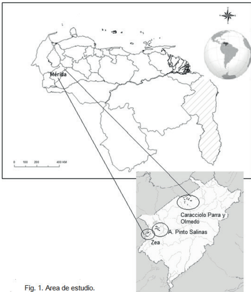
Fig. 1. Área de estudio.